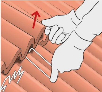
1. Dachziegel anheben.